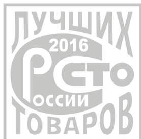
«100 лучших товаров России»