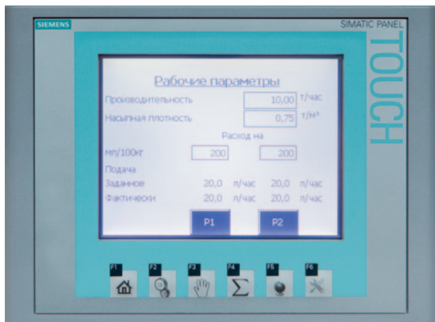
Шкаф управления с типом управления Logo, серийное оборудование.

Через загрузочное отверстие семенной материал поступает в камеру протравливания. Вращающийся распределительный диск распределяет продукт до образования равномерной семенной «завесы».